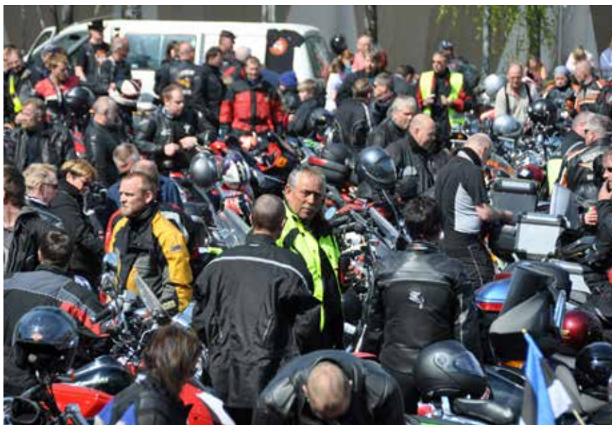
MC-forhandleren er livsnerven i MC-bransjen, og den største møteplassen for oss motorsyklister.